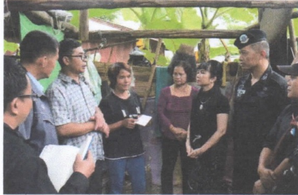
ภาพหลังสร้าง บ้านนางโยม ใจปึง