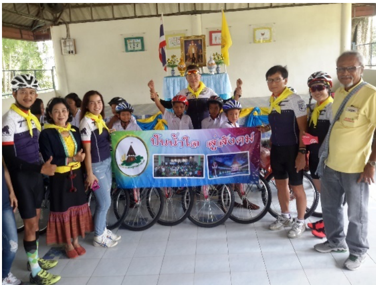
ภาพวันมอบน้ำใจจากชาวเราสู่ชาวกะเหรี่ยงชายขอบป่าเต็ง อำเภอกำแพงแสนจังหวัดเพชรบุรี