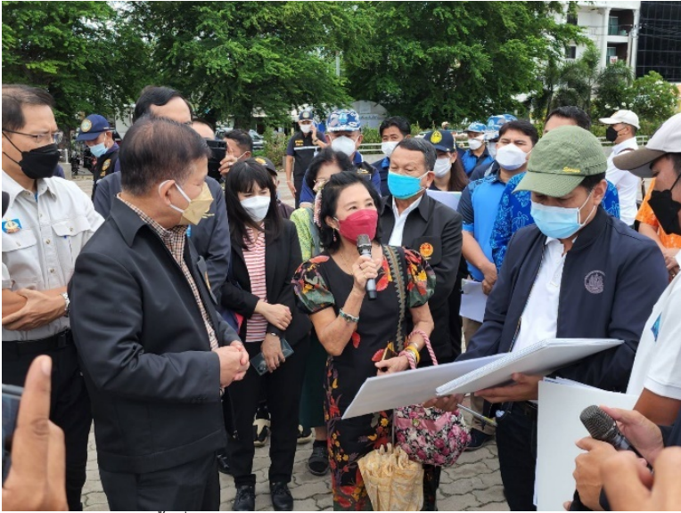
ภาพการประชุมและลงพื้นที่ของสมาชิกวุฒิสภาองผู้ว่าราชการจังหวัดเพชรบุรีและกลุ่มคนรักเมืองเพชร ศปจ.เพชรบุรี เพื่อร่วมแก้ไขปัญหาน้ำท่วมขังและห้องประชุมอำเภอบ้านแหลม จังหวัดเพชรบุรี